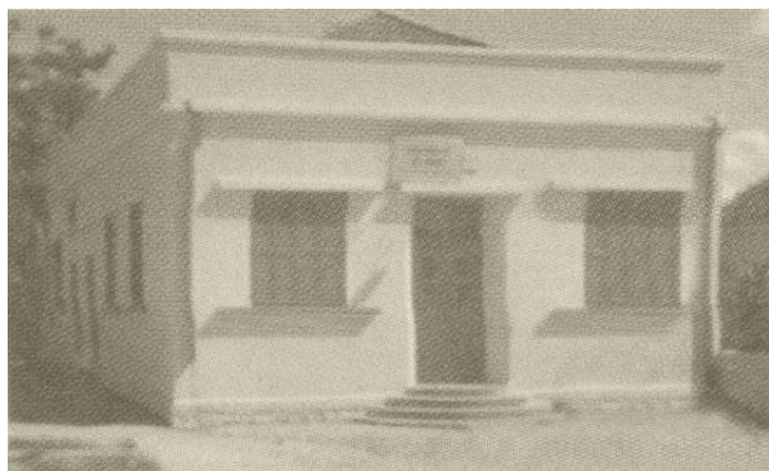
Templo na Rua Maryland em 1924

No ano de 1919, na cidade de Lidköping, na Suécia, Gustavo Nordlund, recebeu a chamada de Deus para trabalhar na seara, e, ao mesmo tempo, teve uma visão da grande multidão de salvos entre os quais estavam os salvos do Brasil. No ano de 1920, durante uma conferência, ansioso por saber o local onde devia trabalhar, Gustavo Nordlund teve a revelação de que o local era o Rio Grande do Sul. Assim, no ano de 1922, obedecendo a vocação divina, Gustavo Nordlund e família iniciaram sua viagem para o Brasil, via América do Norte.