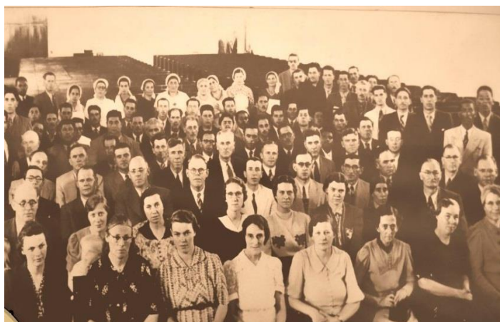
Escola Bíblica Dominical realizada em outubro de 1939, no templo matriz da Assembleia de Deus de Porto Alegre.